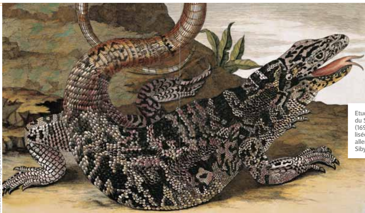
Etude d'un lézard du Surinam (1699-1701) réalisée par l'artiste allemande Maria Sibylla Merian.