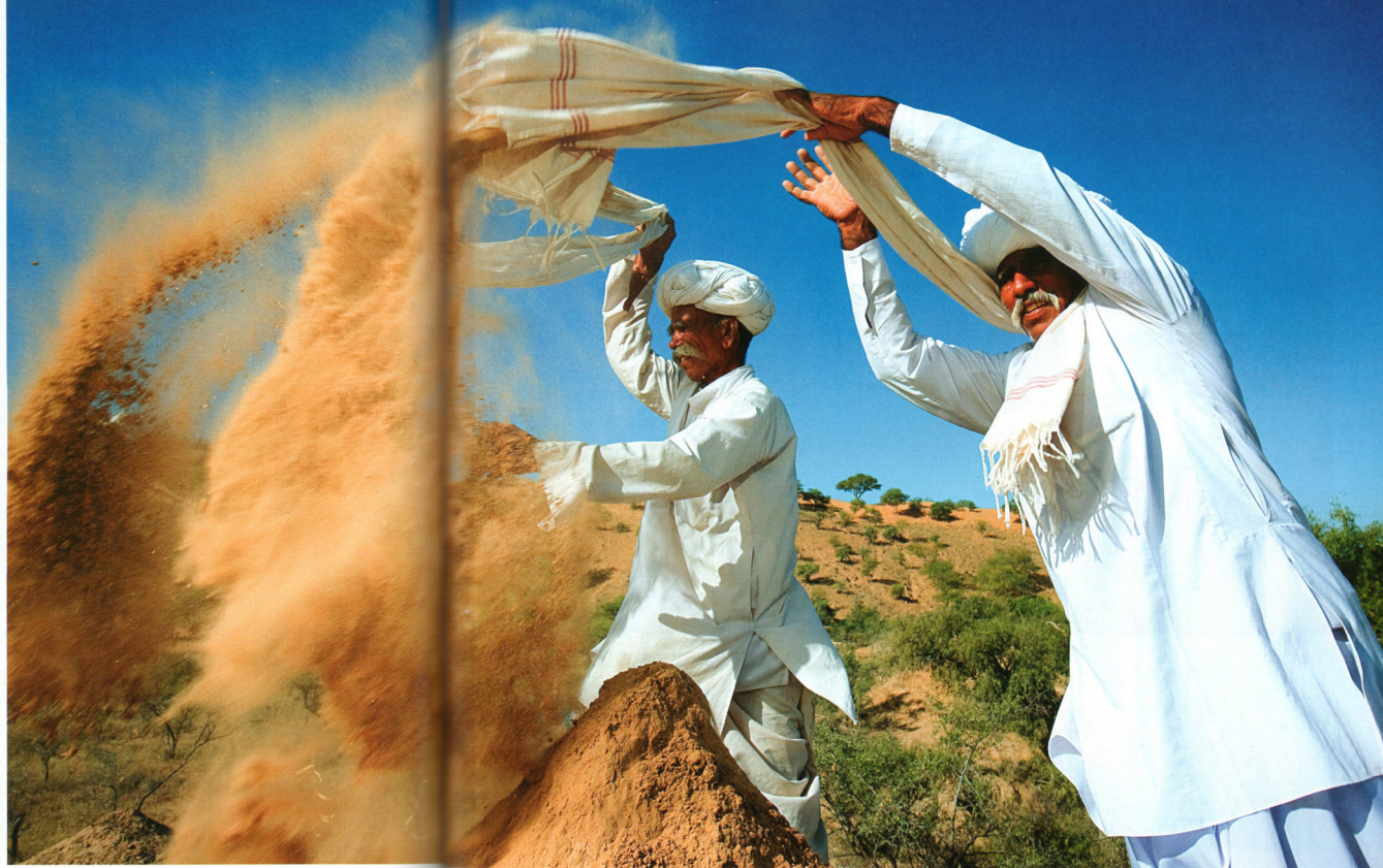
畢什諾依人康姆，在朝聖場合中宣

他的話聽起來有些奇怪，尤其是在這座溫度可飆高至攝氏六十五度的炎熱沙漠。這裡是印度拉加斯坦(Rajasthan)省的塔爾(Thar)大沙漠，又稱作「死亡之地」。世人若是聽到此言，多半會勸他