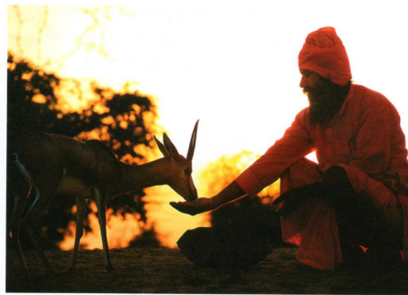
大雨前，畢族人急忙收妥曬好的穀物(左圖)；並不忘為也是家人的動物留一份糧食(上圖)。

兩週前，大馬路上發生了一場車禍，一頭瞪羚被一個計程車司機撞死，遺下一頭幼羚，若納埋了母羊後，將小羊帶回家。他透露，肇事司機已經被關起來，將受到法庭的審判，政府立法保護瀕臨危險的動物，黑羚羊和瞪羚都是受保護的物種。一般而言，這個司機將被