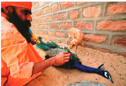
緣於詹畢什瓦上師將轉世為黑羚羊的預言，畢族人對動物關愛有加。依偎在照護人員懷裡的小瞪羚羊(上圖)。祭司為受傷的孔雀噴抗菌劑(左圖)。畢族人與小羊的互動親暱如父子(右圖)。