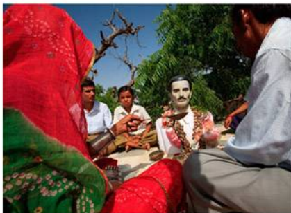
Ce buste représente Ganga Ram, assassiné en 2000 par des braconniers qu'il poursuivait. Il a été décoré en 2001 à titre posthume par le président indien.