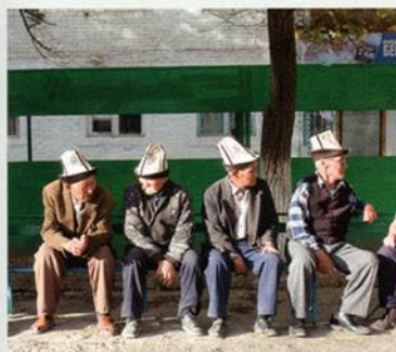
Alain Keller / MYOP

En Polynésie française, c'est le bout du monde. Cette île et son archipel, les Gambier, sont un bien étrange paradis, âpre à vivre, peuplé de perliculteurs, d'ex-légionnaires et de quelques Robinson... Inoubliable. Page 24